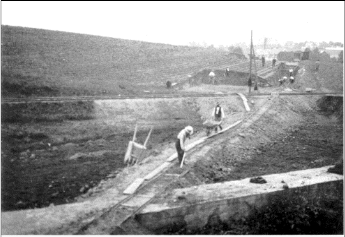
Foto vom Gleisbau

Die Biererzeugung bezifferte sich i.J. 1883 mit 60.240 hl, 1893 mit 102.360 hl, 1897 mit 123.721 hl und 1901 mit 126.240 hl, hat sich somit seit 1883 mehr als verdoppelt. In der Mälzerei werden jährlich 10.000 q Malz erzeugt.“ Interessant ist vielleicht auch, dass die Brauerei bis zum 2. Weltkrieg 40 Brauereipferde besaß für den Transport der Bierfässer.